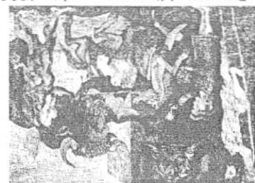
P. PICASSO, Minoan Warrior , 1935