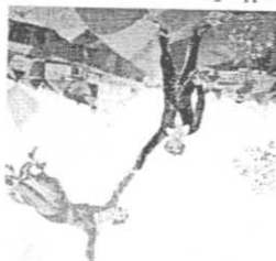
M. Chagall, La passeggiata (1917-18)