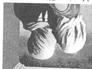
R. Magritte, Gli amanti (1928)