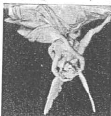
A. Canova, Amore e Psiche (1788-93)

«L'innamoramento introduce in questa opacità una luce accecante. L'innamoramento libera il nostro desiderio e ci mette al centro di ogni cosa. Noi desideriamo, vogliamo assolutamente qualcosa per noi. Tutto ciò che facciamo per la persona amata non è far qualcosa d'altro e per qualcun altro, è farlo per noi, per essere felici. Tutta la nostra vita è rivolta verso una sfera di vita superiore dove si ottiene tutto o si perde tutto. La vita quotidiana è caratterizzata dal dover fare sempre qualcosa d'altro, dal dover scegliere fra cose che interessano ad altri, scelta fra un disappunto più grande ed un disappunto più lieve. Nell'innamoramento, la scelta è fra il tutto e il nulla. [...] La polarità della vita quotidiana è fra la tranquillità ed il disappunto; quella dell'innamoramento fra l'estasi e il tormento. La vita quotidiana è un eterno purgatorio. Nell'innamoramento c'è solo il paradiso o l'inferno; o siamo salvi o siamo dannati.» F. ALBERONI, Innamoramento e amore , Milano 2009